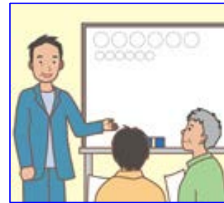
農作業安全指導員の育成