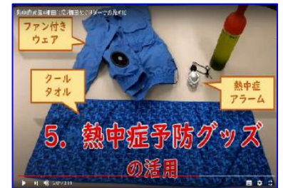
現場の安全指導で活用可能な安全啓発コンテンツの整備 (例：高齢者への安全啓発、熱中症対策など)