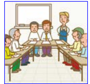
農作業安全研修体制の整備