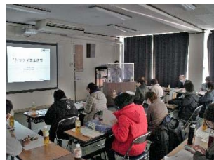
トラクタ安全講習