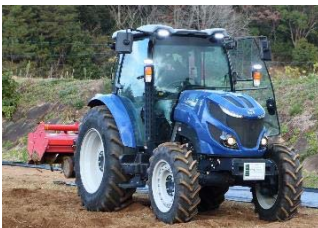
自動操舵付トラクタの体験