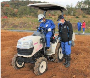
トラクタの安全な使用方法