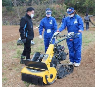
草刈機の安全な取り扱い