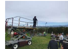
高所作業台車を利用した摘果作業