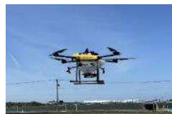
ドローンサービスによる防除