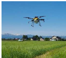
ドローンサービスによる農薬散布・追肥