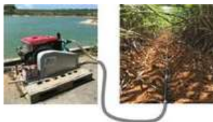
遠隔操作によるかん水ポンプの起動