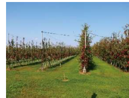
省力樹形への転換