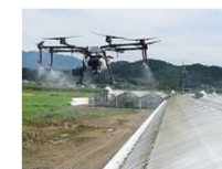
ドローンサービスによる遮光剤の塗布