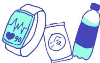
ウェアラブル端末、 応急セット