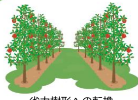
省力樹形への転換