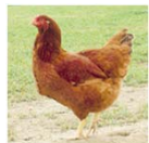
在来種の特徴を活かせる素材鶏の♀