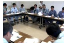
協議会による検討