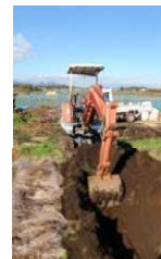
天地返し (土層改良)