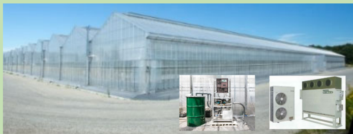
CO 2 貯留・供給装置 ヒートポンプ

※強い農業づくり総合支援交付金の産地収益力の強化で対象となる全ての施設が対象（詳細は強い農業づくり総合支援交付金パンフレットを参照ください。）