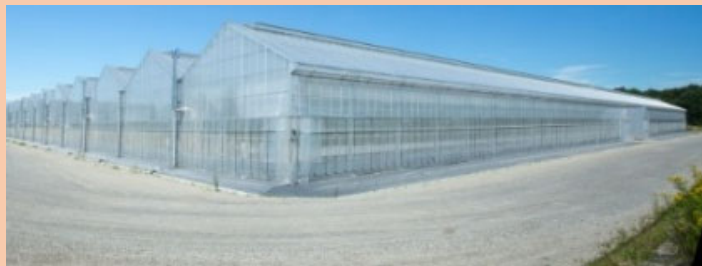
低コスト耐候性ハウス

※強い農業づくり総合支援交付金の産地収益力の強化で対象となる全ての施設が対象（詳細は強い農業づくり総合支援交付金パンフレットを参照ください。）