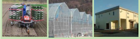
農業機械のリース導入・取得 生産資材の導入 施設整備