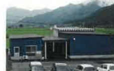
敷地内での精肉加工施設