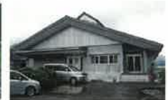
旧給食センターでの製品加工施設