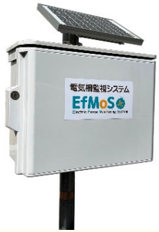
エフモスジュニア電柵電圧計

協和テクノ(株)(長野) 026-245-5438 https://www.efmosjr.com/site/ 鳥獣害防除器具の製造販売 電気柵の販売・施工 他