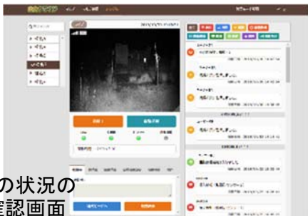
檻の状況の確認画面