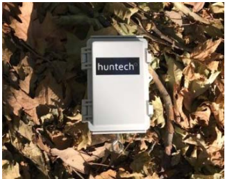
くくりわな取付例 ハコわな取付例

株式会社huntech(ハンテック) 2017年9月26日設立 東京都目黒区目黒本町5-7-11 三幸ビル401 050-5218-9424 ※お問合せはメールにてお願いいたします。 info@huntech.jp 鳥獣捕獲・ジビエリ活用関連機器・サービスの企画・開発・販売。 スマートトラップの他、捕獲・加工情報PF「ジビエクラウド」を手掛ける