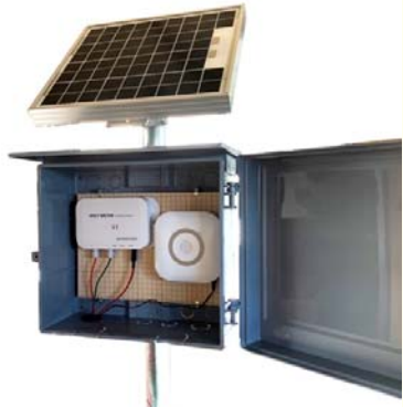
エフモスジュニア電柵電圧計

協和テクノ(株)(長野) 026-245-5438 https://www.efmosjr.com/site/ 鳥獣害防除器具の製造販売 電気柵の販売・施工 他