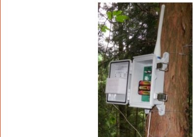
くくり罾の親子型・子機