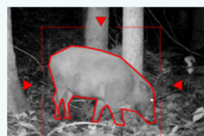
監視イメージ ※実際の写真とは異なります。