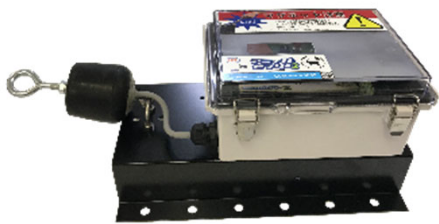
アニマルセンサー2