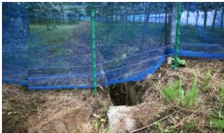
ネットの外側に 10 cm 間隔で 3 段設置