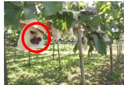
ぶどうに対する被害状況

資材費は生産者負担で、設置については、農業協同組合と県で行った。結果については、県で情報収集した。