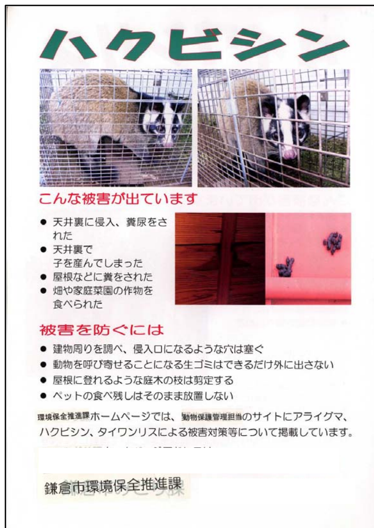
鎌倉市が配布しているパンフレット