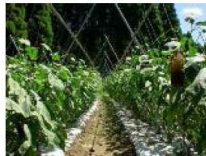
ナス栽培(大多喜町)