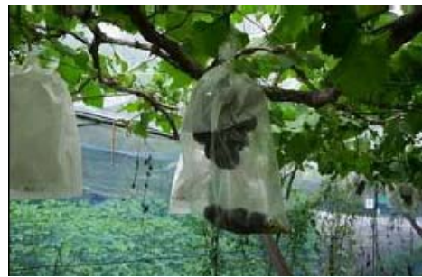
ポリプロピレン袋