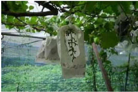
慣行紙袋 (窓付き 37g/m 2 )

ぶどうの袋は、①慣行紙袋、②ポリプロピレン袋、③不織布袋、④厚紙袋の4種で試験を行った。