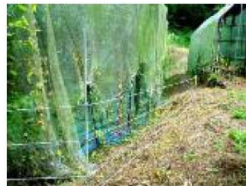
簡易型電気柵(いすみ市岬町谷上 梨園)