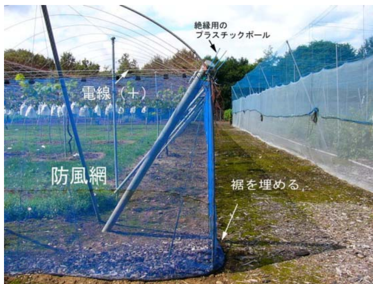
ぶどう園に設置された「白落くん」