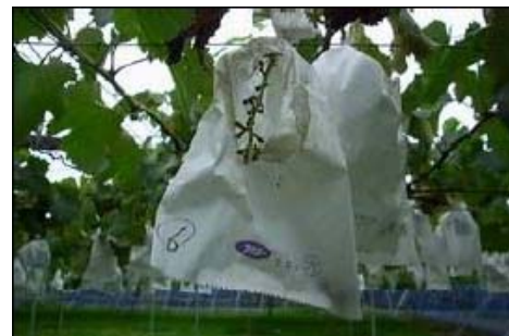
厚紙袋 (43 と 50g/m 2 の 2 種類)