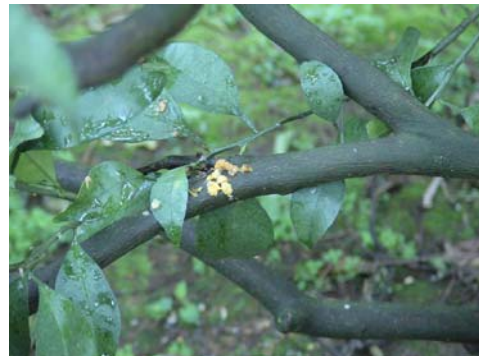
夏みかん袋の吐き捨て