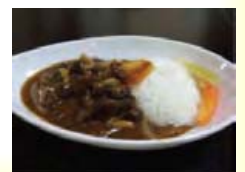
シカ肉ハヤシライス