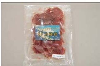
エゾシカの生ハム