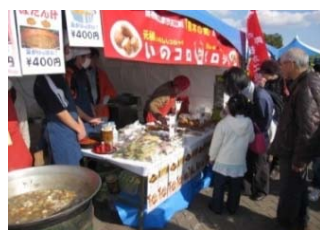
毎年県外イベントに参加