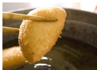
平成22年度開発新商品 「ピロシシ」 (ピロシキ+イノシシ)