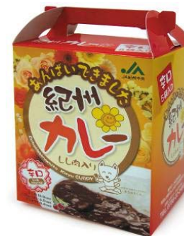
シシ肉入りのカレー