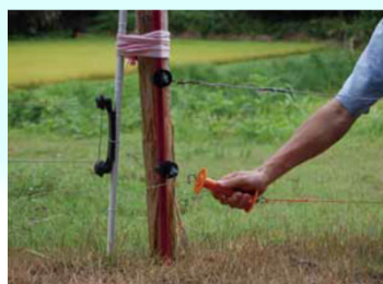
侵入防止柵の設置