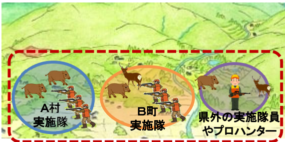
被害防止活動の効率化