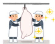
処理加工技術の向上