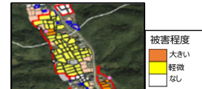
被害等の可視化、対策への活用

① ICT活用の定着に向けた取組の推進 データを活用した被害対策や、ICTを活用できる人材の育成等を支援