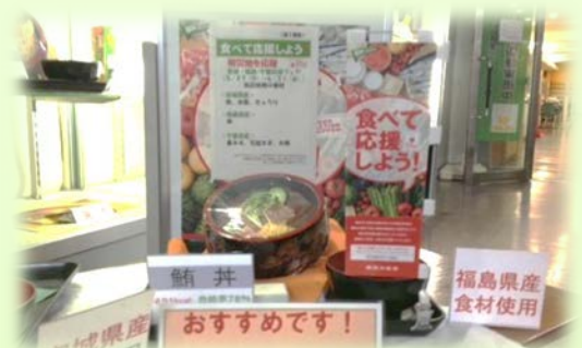
被災地産食品を使用したメニューの提供