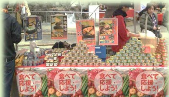
被災地産食品の販売フェア