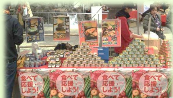
被災地産食品の販売フェア