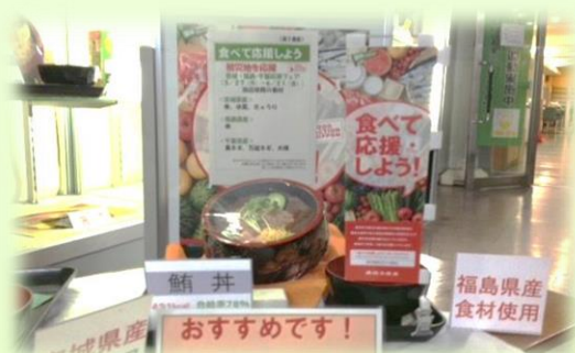
被災地産食品を使用したメニューの提供