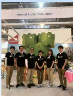
▲輸出業務経験のあるスタッフを採用