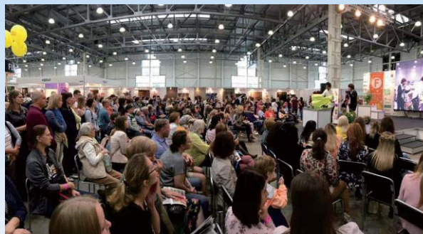
▲国際見本市に出展