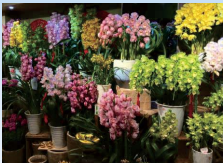
▲海外で人気のシンビジウム