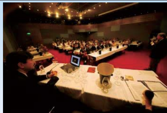
▲ VINEXPOでのテイastingセミナー