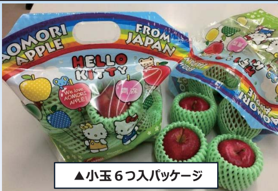
▲小玉6つ入パッケージ