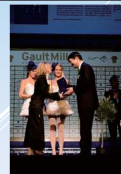
▲2010年 ゴーミヨ表彰式でプレゼンター

2019 輸出に取り組む優良事業者表彰 / 主催: 公益財団法人 食品等流通合理化促進機構