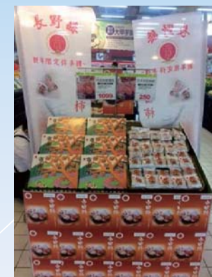
▲スーパーでの売り場作り

2019 輸出に取り組む優良事業者表彰 / 主催: 公益財団法人 食品等流通合理化促進機構