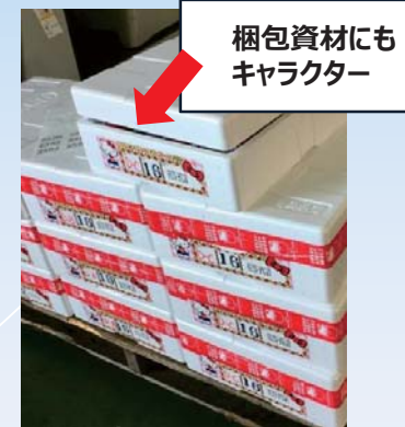
梱包資材にもキャラクター