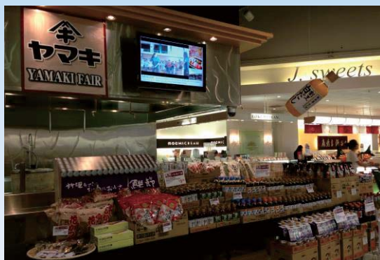
▲ ロスアンゼルススーパーの売場