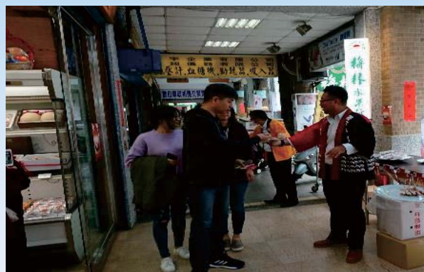
▲果実専門店（梅林）で試食会を実施