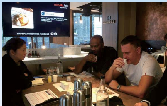
▲ 現地店舗との商談風景