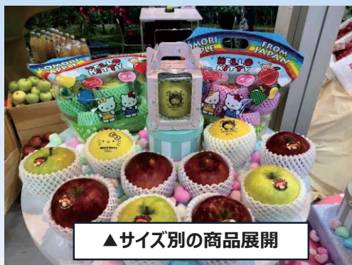
▲サイズ別の商品展開