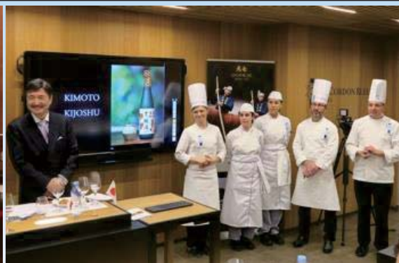
▲ル・コルドンブルーでのセミナー