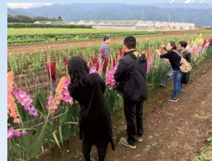
▲生産地にバイヤー招聘

2019 輸出に取り組む優良事業者表彰 / 主催: 公益財団法人 食品等流通合理化促進機構