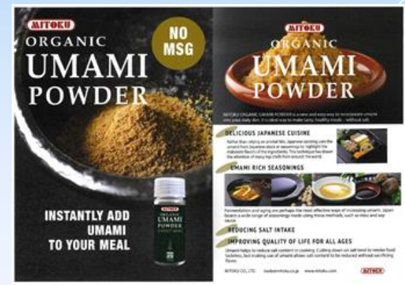
▲ミトクブランドオーガニック製品