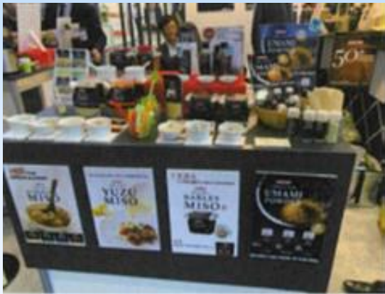
▲展示会のミトクブース