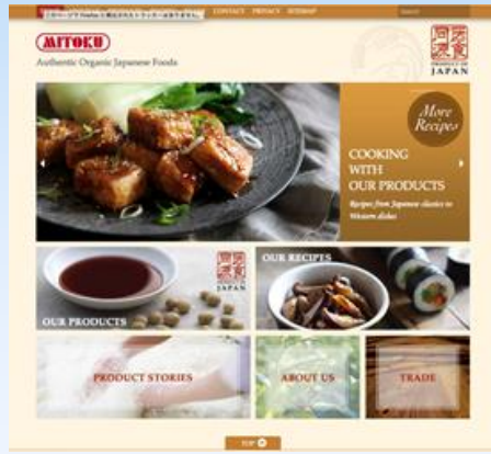
▲海外向けホームページ