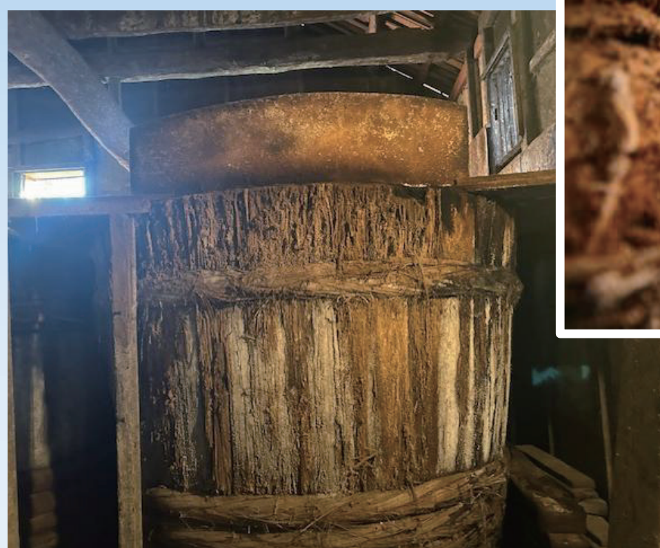
▲ 150年前から使用する木桶