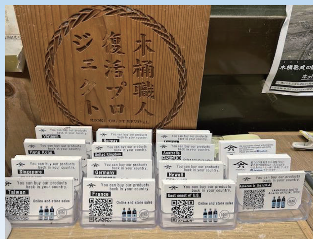
▲ 各国の取り扱い店が分かるQRコード