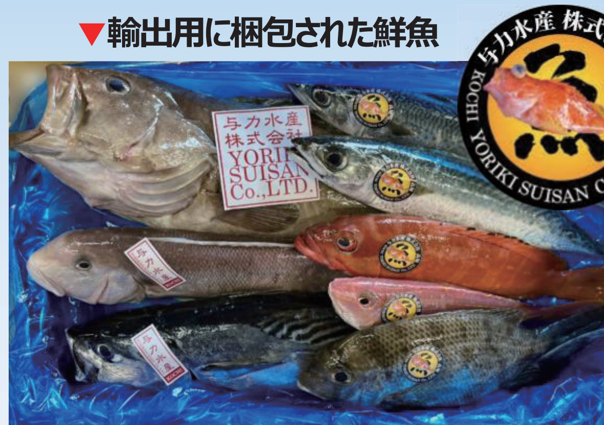
▼ 輸出用に梱包された鮮魚