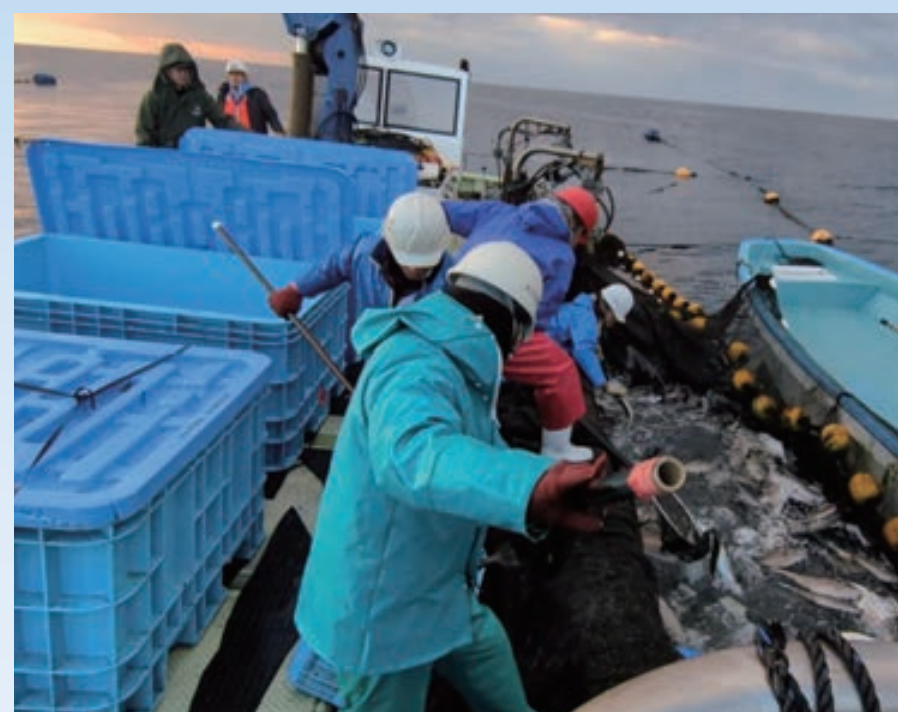
▲ 定置網漁風景(10年ぶり復活)