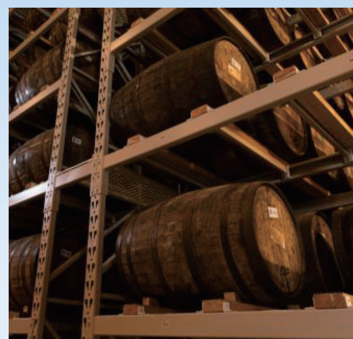
◀ 地元産ミズナラを使用した樽で熟成される原酒 ▼