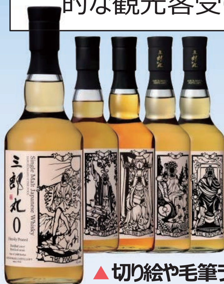
▲ 切り絵や毛筆ラベルが日本的だと喜ばれる