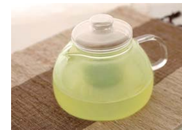
用红茶壶 紅茶用ポット