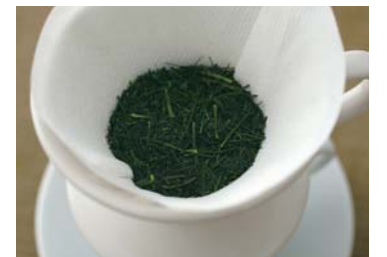
用滤纸 ペーパーフィルター