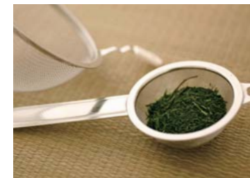
用滤茶网 茶漉して