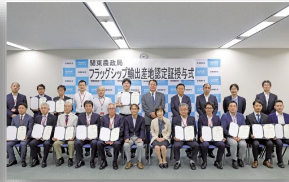
関東農政局での認定賞授与式の様子