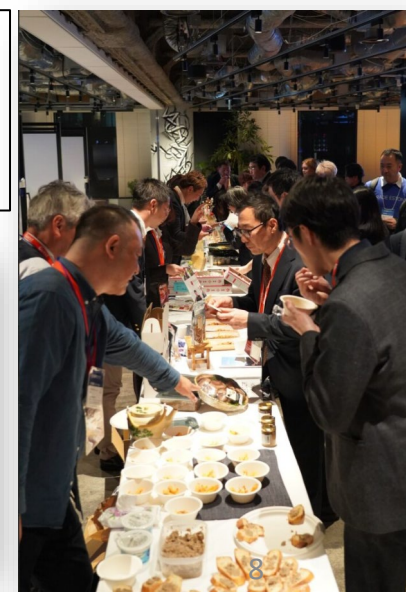
昨年度の超会議の様子