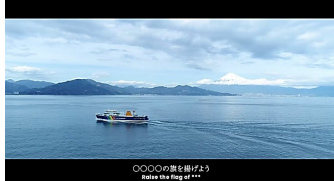
(認定フラッグシップ輸出産地紹介PV)