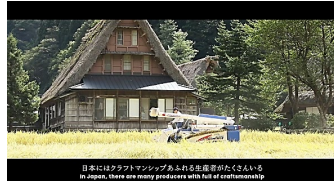
(フラッグシップ輸出産地PV)