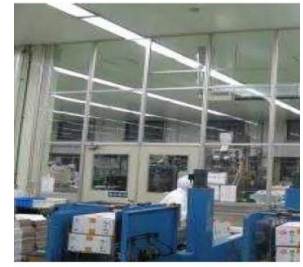
空気を經由した汚染を防止する設備（パーティション）の導入