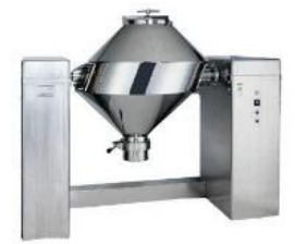
製造ラインにおいて添加物混入を回避する輸出専用ミキサーの導入