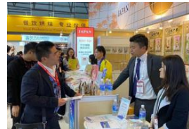
海外バイヤーとの商談