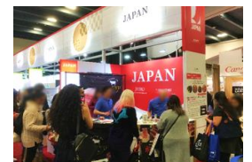
海外見本市への出展