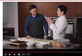
日本産食材に関する情報発信