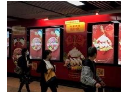
駅でのパネル広告