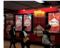
駅でのパネル広告