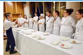
海外料理学校との連携