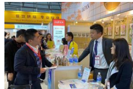
海外バイヤーとの商談