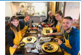
食体験コンテンツの造成