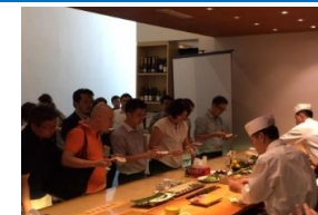
日本産食材サポーター店との連携