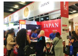
海外見本市への出展