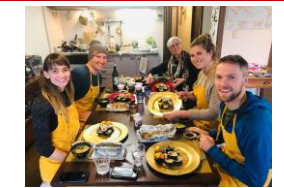
食体験コンテンツの造成