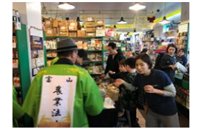
小売店でのプロモーション