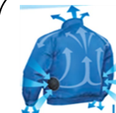
熱中症対策として、 服の中に外気を取り 入れる小型電動ファン を装備した作業服