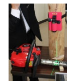
正しい受け口作 成をレーザーで 補助する装置