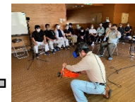
伐木作業用のVR機 器を使用した労働安 全研修の開催