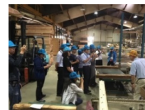
製品事業者との連携等、 販売力強化に関する研修の実施