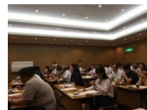
集合研修等により輸出等に 必要な知見を提供