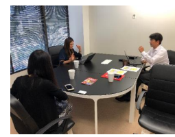
ECとのマッチング支援