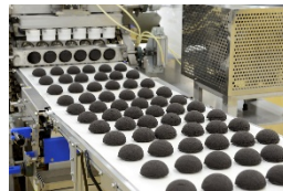
ニーズ対応商品の開発