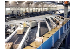
大ロット製造のための機器