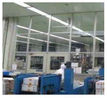
空気を經由した汚染の防止設備（パーティション）の導入