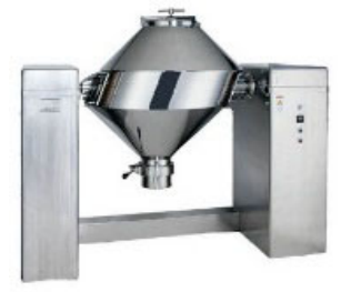
製造ラインに輸出専用のミキサーを追加導入し、添加物混入を回避