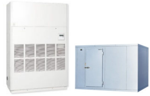
温度管理を要する装置・設備の導入