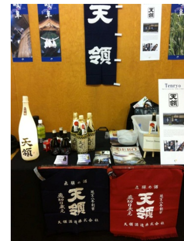
2012年 サンフランシスコ 「sake dey」