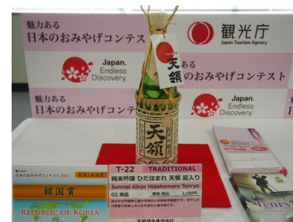
「魅力あるお土産コンテスト」 にて韓国賞受賞(観光庁)