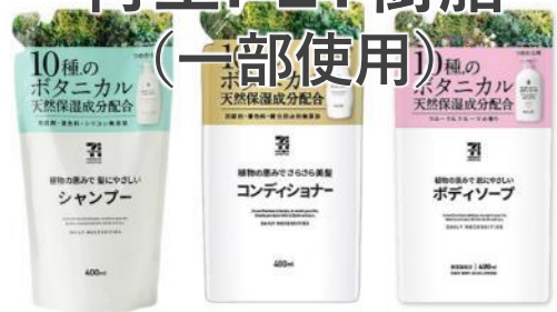
再生PET樹脂 (一部使用)