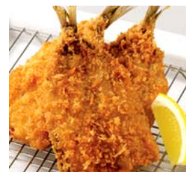
関東1都3県と近畿地区に520店舗を展開するオリジン弁当