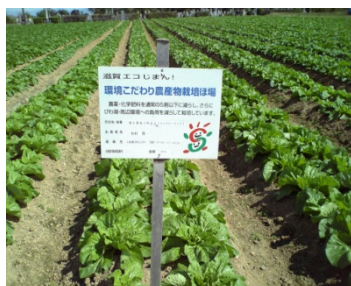
滋賀県認証「環境こだわり農産物」 (はくさい)

日替わりで使用食材の種類も多いことから、原料の安定調達を図るため、地元生産者と契約し、滋賀県認証「環境こだわり農産物」を調達するとともに、流通業者等とは緊密な連携を図り鮮度維持に努め、地域に密着した総菜宅配業に取り組んでいる。10年前から食材の産地を毎週事前に顧客へ配布している。野菜(じゃがいも、玉ねぎ)の芯腐り問題を解決するため平成19年から自社内に「光センサー」を導入して品質向上に努めている。