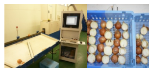
光センサーによるたまねぎ