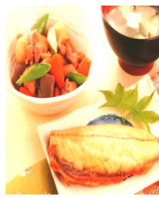
国産さばの塩焼き 筑前煮/味噌汁