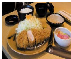
平牧三元豚厚切り ロースかつ膳