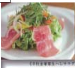
平牧金華豚 生ハムサラダ