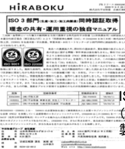
ISO9001、ISO22000 (生産・加工・加工肉 製造)取得