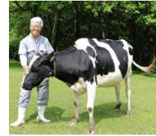
↑↓受賞者と協働で取組を行っている生産者の一例