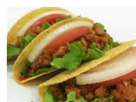
発芽大豆素材を用いたタコス