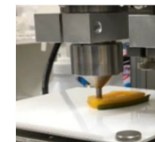
3Dフードプリンターを用いた介護食

事業戦略検討、試作品製造、マーケティングリサーチ、商品デザイン、テストマーケティング、販路確保、原材料確保