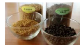
昆虫飼料と有機肥料ペレット