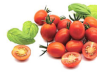
ゲノム編集育種技術を活用した機能性成分含有量が多いトマト