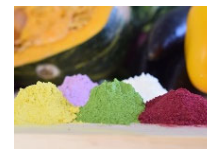
未利用農産物の微細粉末化によるアップサイクル