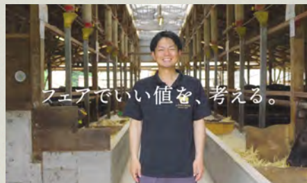
生産現場の生声を伝えている 生産者インタビュー動画