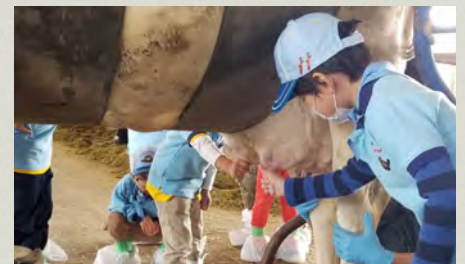
親子が参加した 生産現場体験のレポート動画

お問い合わせ先：フェアプライスプロジェクト事務局 Mail : info@fairpriceproject.com