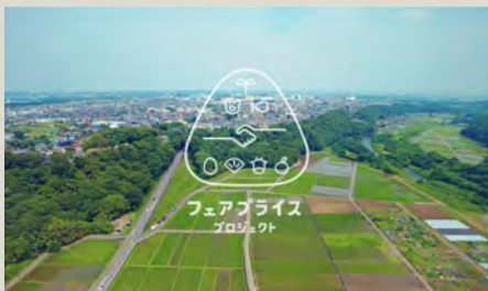
フェアプライスプロジェクトの コンセプト動画