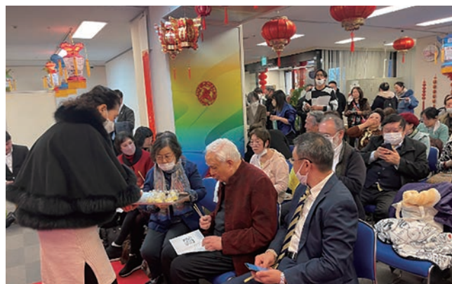
華人頻道（華人Channel Japan）との連携で在日中国人実業家の方々を対象に商品評価会を実施。