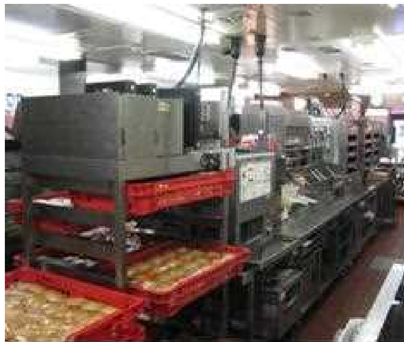
★ MFYラインを後ろから見たところ