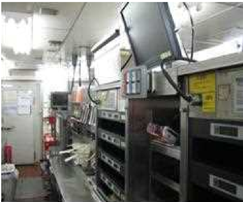
★ MFYラインを前から見たところ