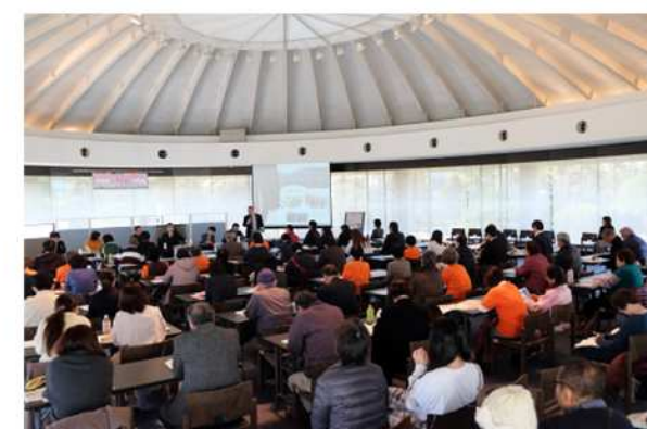
2019.2 愛媛の子ども食堂セミナー 2019.8 南予事務局開所式 2020.2 食品ロス削減シンポジウム