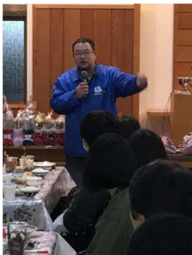
2017.12 にはま 子ども食堂 中村松木店