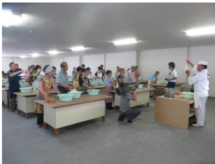
手打ちうどん体験 （於：さぬき麺業）