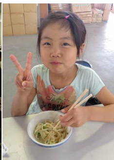
もちろん、残しません！