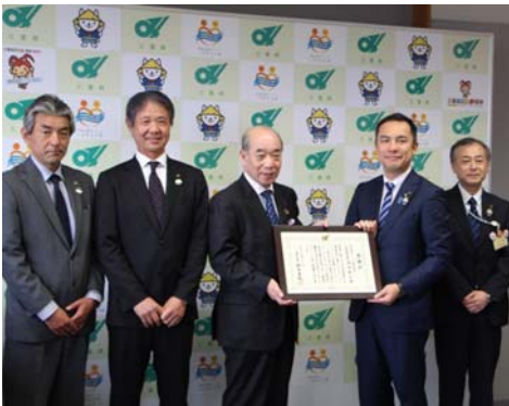
三重県庁での感謝状授与