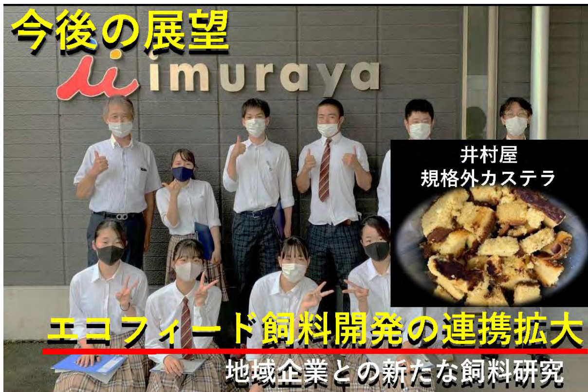
井村屋 規格外カステラ