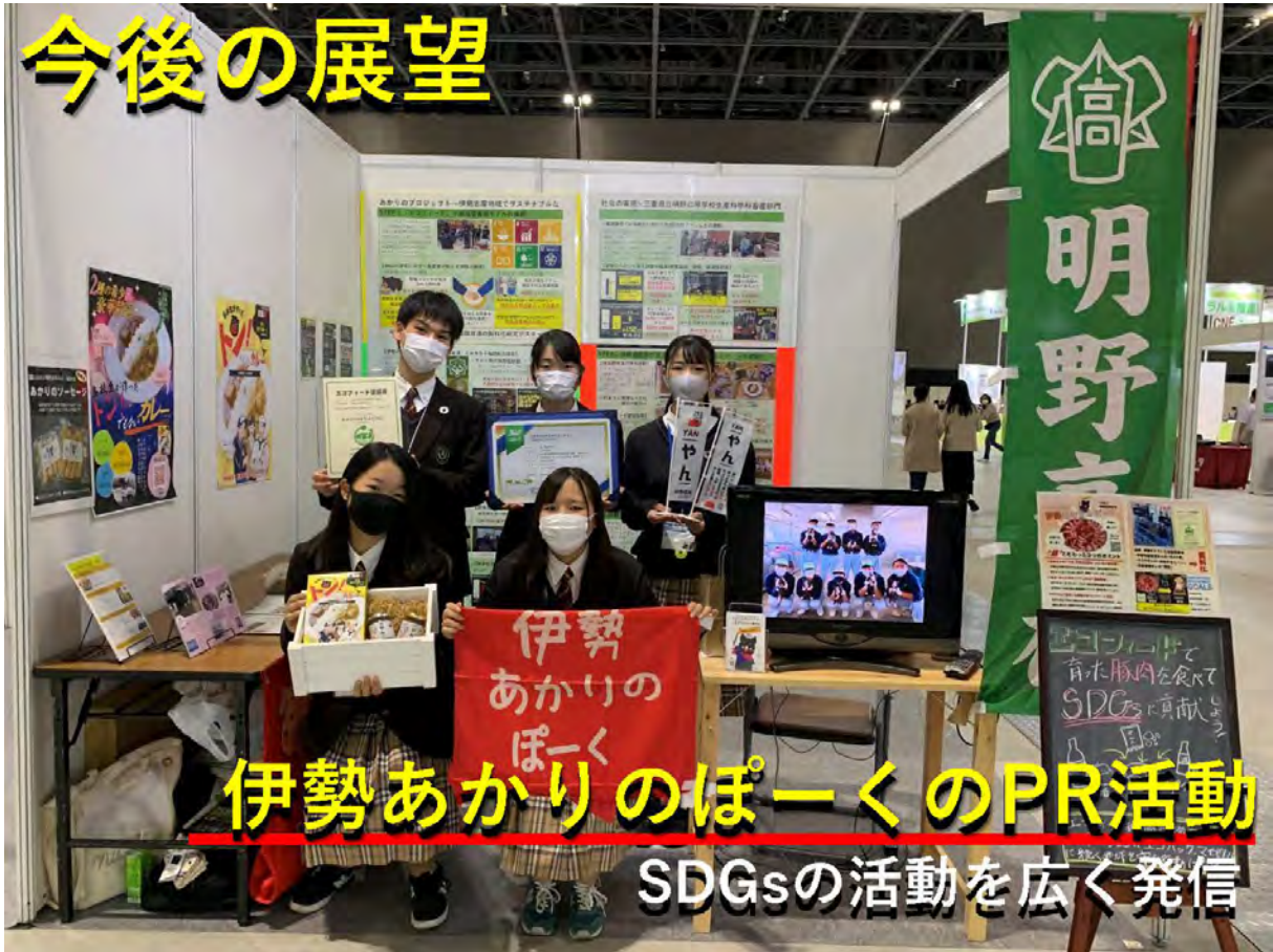
伊勢あかりのぽーくのPR活動 SDGsの活動を広く発信