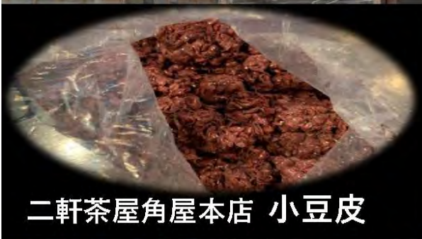
二軒茶屋角屋本店 小豆皮