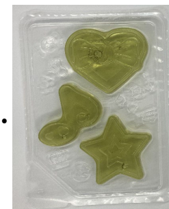
【イメージ】1か月毎の経時変化確認